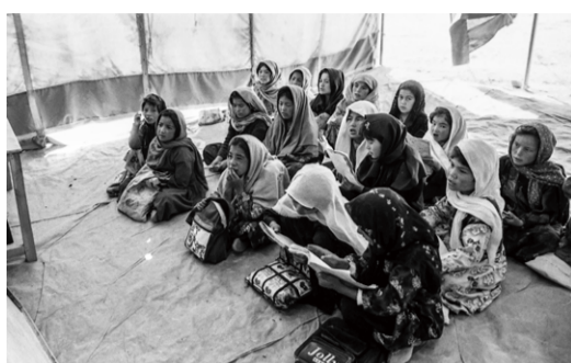
タリバン政権が崩壊し、小学校に通えるようになった少女たち。

9.11テロ事件をきっかけにフォトジャーナリストとなり、世界中の難民キャンプや貧困地域などの取材を続けている川畑さんに、取材に対する思いや志を伺いました。